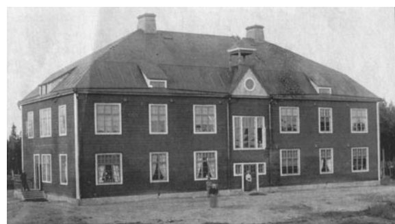
Officersbostaden i Gammelstad flyttas till Rutvik